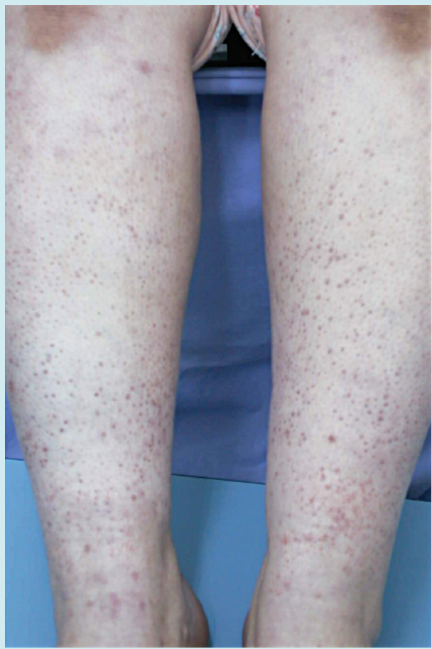
Resim 1. Ciltte alt ekstremitelerde belirgin palpable purpuralar.