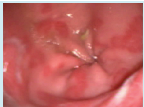
Resim 3. Midede antrumda mukozadan kabark hiperemi alanları, erozyon ve ülserasyonlar.

Çoğunlukla GIS kanamalar ince barsak lezyonlarından kaynaklanmaktadır ancak, bizim olgumuzda olduğu gibi